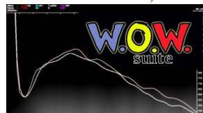
WOW: Seguimiento de patrón preestablecido