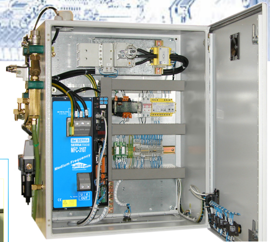
AS-5 Versión 10kHz