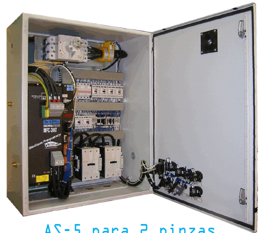
AS-5 para 2 pinzas